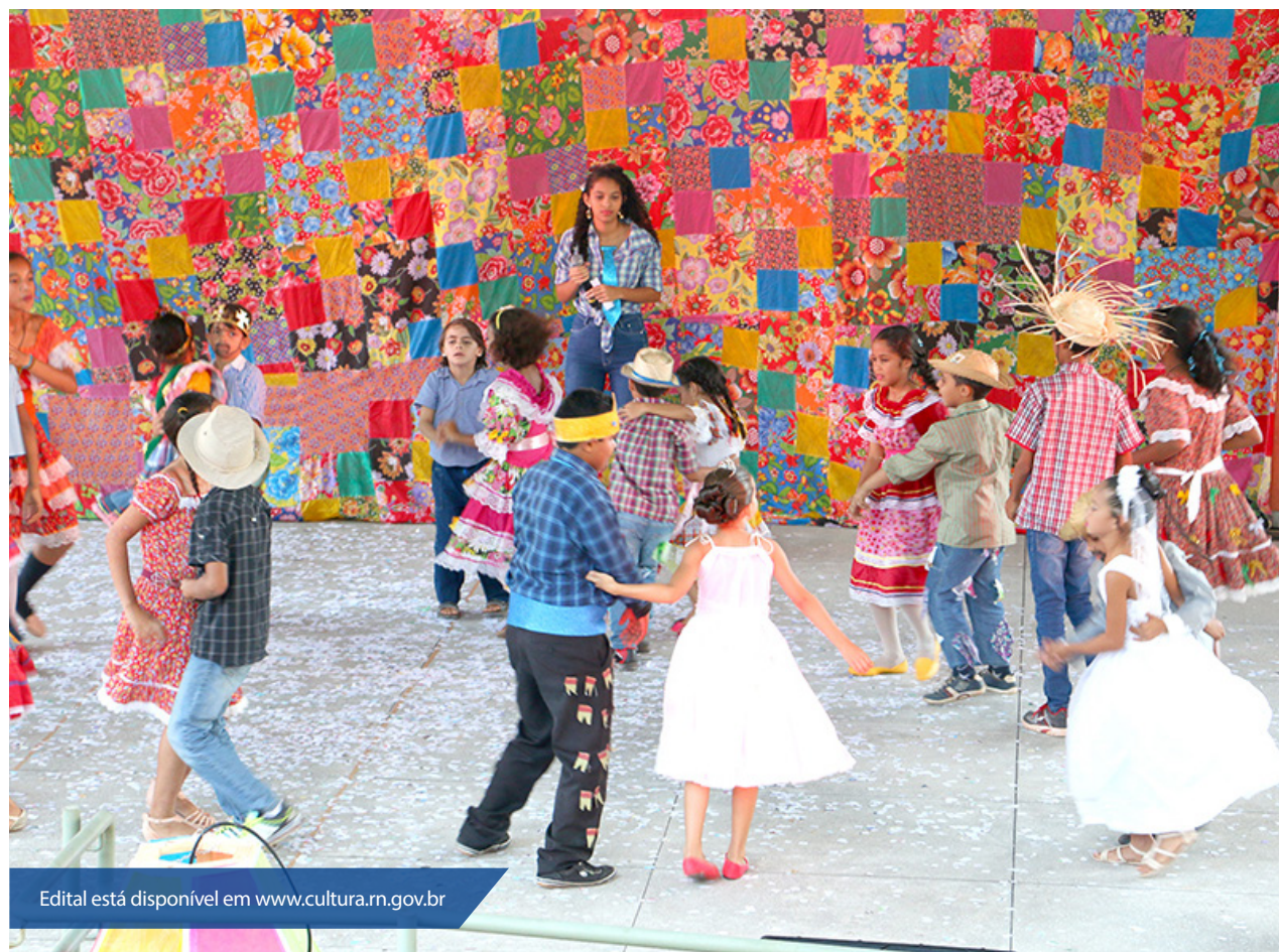
Edital está disponível em www.cultura.rn.gov.br

A divulgação do resultado da etapa de habilitação será feita no dia 20 de junho. O resultado final do prêmio será publicado no Diário Oficial do Estado em 3 de julho.