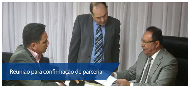
Reunião para confirmação de parceria

Para o diretor-presidente da Fundação, esta iniciativa visa atrair os jovens para despertar o interesse em pesquisa e