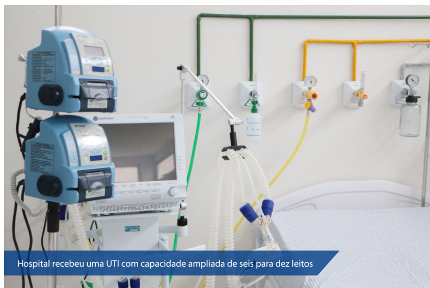
Hospital recebeu uma UTI com capacidade ampliada de seis para dez leitos

O serviço de trauma-ortopedia já estava em funcionamento desde abril deste ano e foi entregue na última semana de forma simbólica. Dois ortopedistas se revezam em um plantão para cirurgias de urgência, emergência e eletivas. De abril a junho já foram realizadas 164